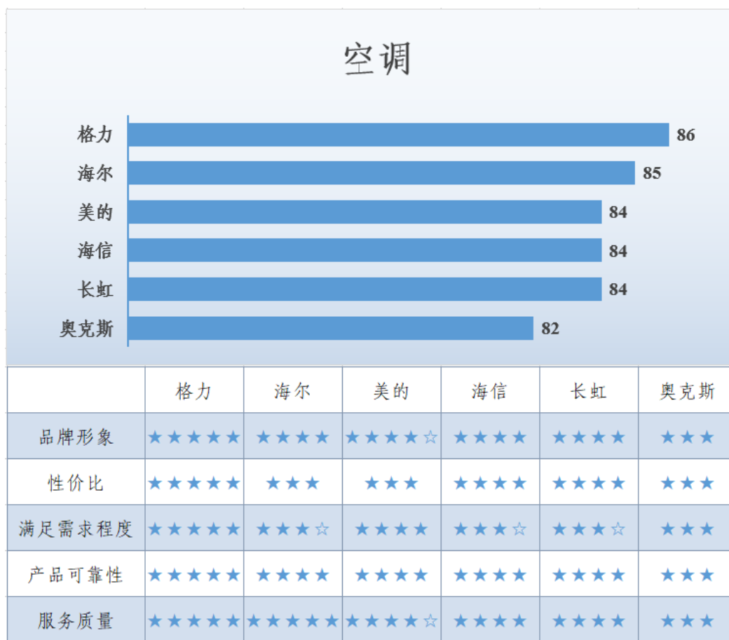
图 4 空调满意度调查结果

格力空调的满意度得分最高，为 86 分；其次是海尔，为 85 分。从调查的主要指标来看，格力在品牌形象、性价比、产品可靠性以及满足需求程度方面，都得到消费者较高的认可；在服务质量方面，海尔和格力的表现较好。调查显示，消费者对该类产品主要关注安装、配送服务以及噪音、省电性、制冷/制热效果等方面。空调满意度调查结果见图 4。