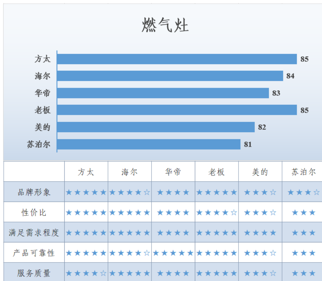
图 11 燃气灶满意度调查结果

调查显示，消费者对该类产品主要关注安装服务、安全性、打火时间、火力大小等方面。燃气灶满意度调查结果见图 11。