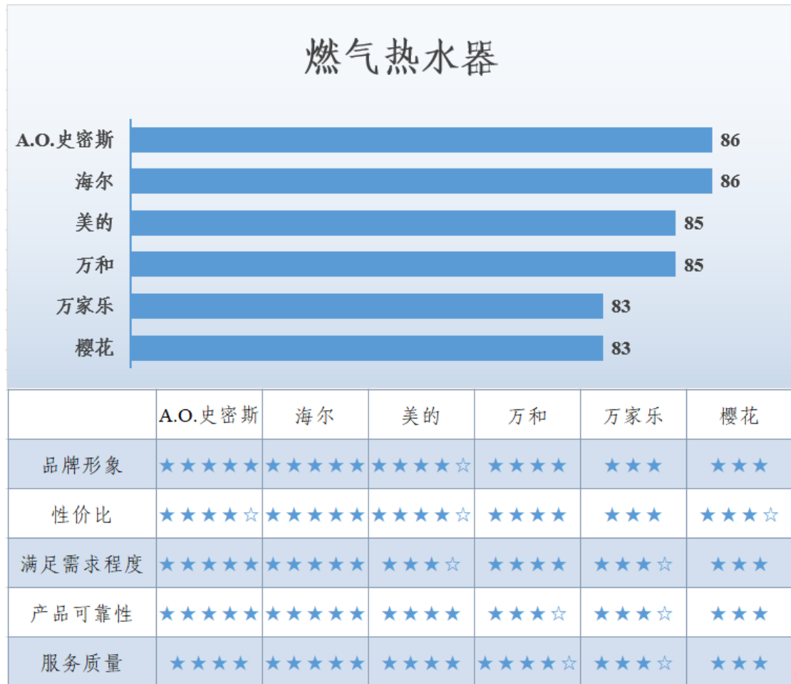
图 9 燃气热水器满意度调查结果