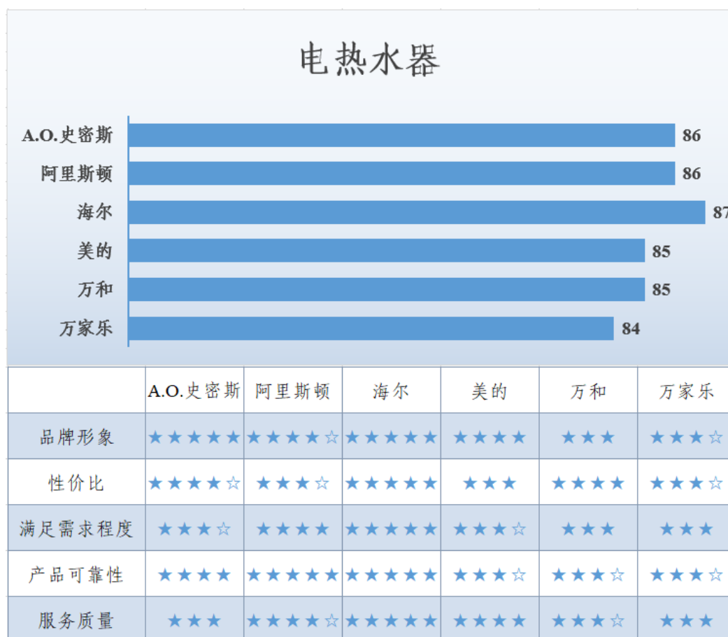
图 8 电热水器满意度调查结果

在产品可靠性方面，海尔和阿里斯顿的认可程度更高；在服务质量方面，海尔表现更为突出。调查显示，消费者对该类产品主要关注产品安装、容量、能耗、加热时长等方面。电热水器满意度调查结果见图 8。