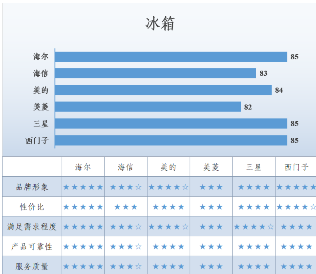
图 2 冰箱满意度调查结果

海尔、三星和西门子冰箱的满意度得分最高,均为 85 分;其次是美的,为 84 分。从调查主要指标来看,海尔在各个调查指标上均得到消费者较高认可,尤其是产品可靠性和服务质量方面,优势明显;西门子在品牌形象方面认可度具有一定优势;在满足用户需求程度方面,美的和三星的表现较好。调查显示,消费者对该类产品主要关注节能省电、噪音、食品串味、保鲜制冷效果及配送服务等方面。冰箱满意度调查结果见图 2。