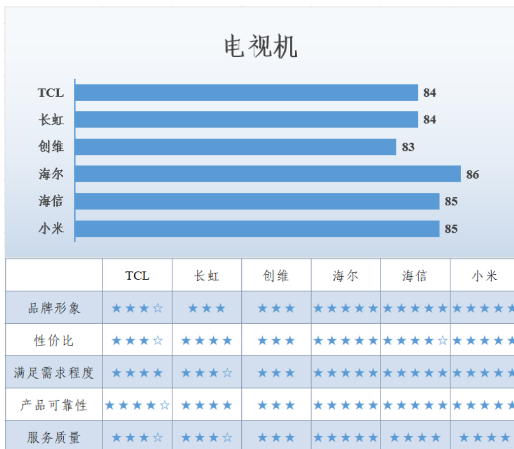
图 7 电视机满意度调查结果

务质量方面，海尔更具行业优势，得到消费者的高度认可。调查显示，消费者对该类产品主要关注图像显示效果、音响效果、网络功能以及配送、安装等方面。电视机满意度调查结果见图 7。