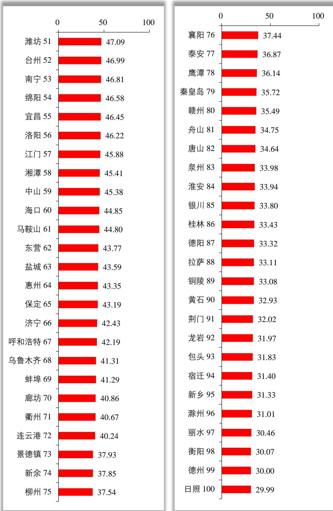
图2 创新型城市综合指数百强榜（续）