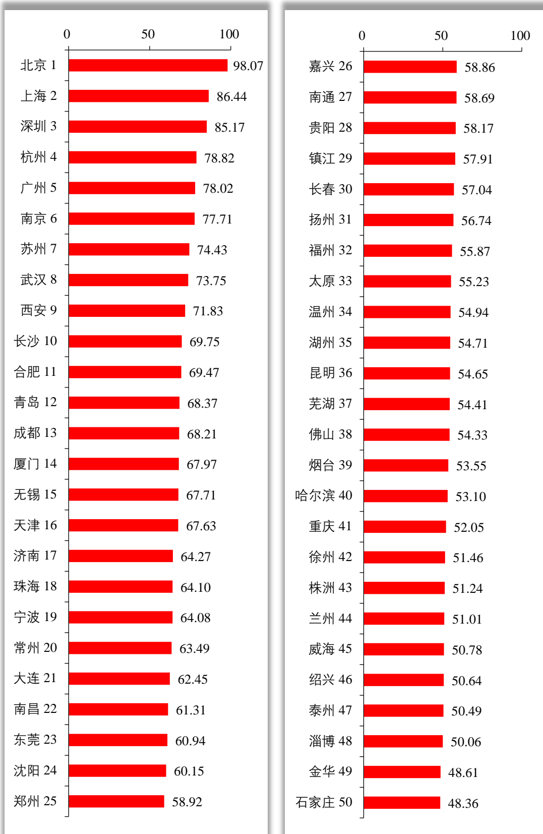
图2 创新型城市综合指数百强榜