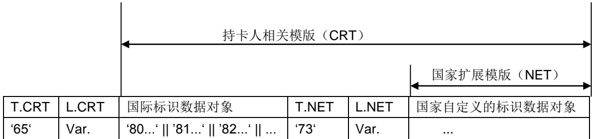
图2 嵌入了NET的标识数据的CRT模板